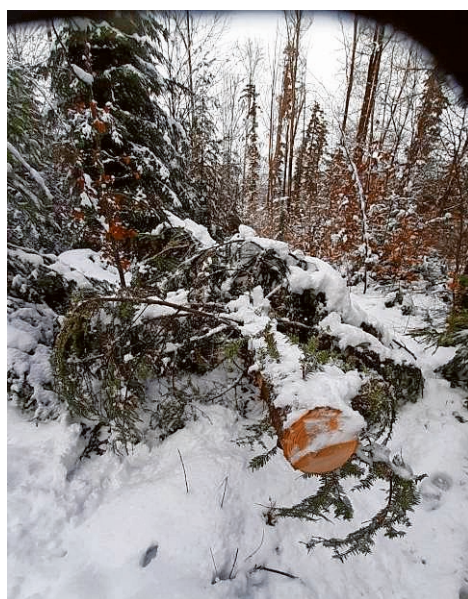
Ce sapin était visiblement trop grand pour rentrer en entier dans un coffre.