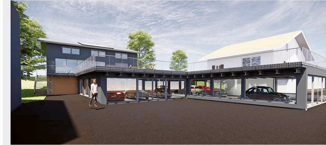
Voilà à quoi ressemblera le garage Blank d'ici quelque temps.